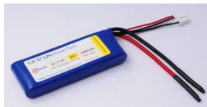
G3 CX 25C Series