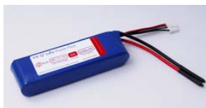
G3 VX 35C Series